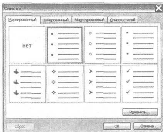
Рис. 6.11. Диалоговое окно Список позволяет выбрать различные стили списков

Появится диалоговое окно Bullets and Numbering (Список), показанное на рис. 6.11.